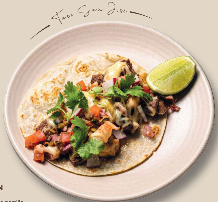
Taco San José