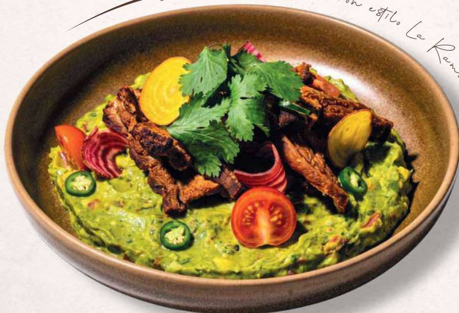
Guacamole con chicharron estilo La Ramos

Aguacate machacado con cebolla, jitomate, cilantro y limón, servido con 220 g de chicharrón estilo La Ramos.