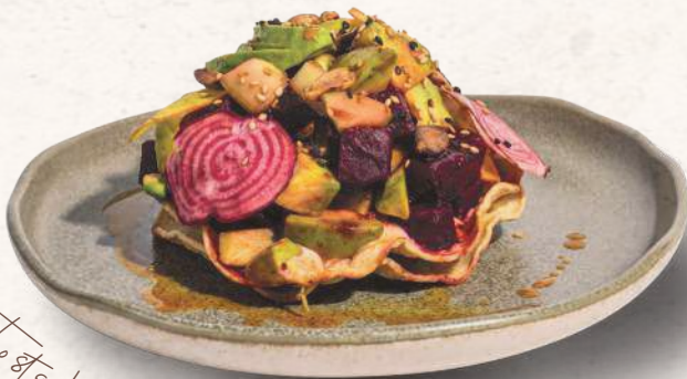
Tostada de betabel

Ensalada de betabel rostizado con mix de lechugas, cremoso de cabra, naranja y frutos rojos, con vinagreta de jamaica.