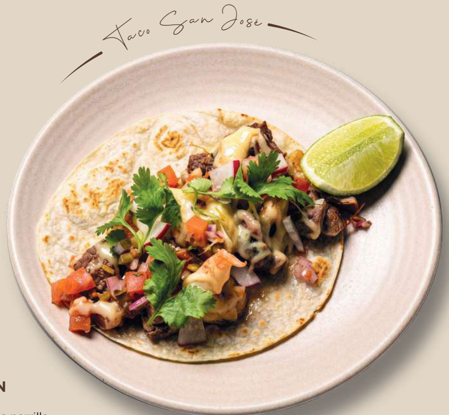
Taco San José